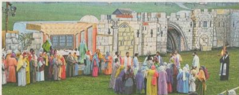
Jesus spricht zum Volk und segnet die Kinder.

brazhofen entworfen und gemalt, ebenso die Ölberg-Kulisse. In einem Container oben am Berg ist die Licht- und Ton-technik untergebracht. Die Zuschauer können am Hang stehend die Passionsspiele mit Blick bis zu den Bergen erleben.