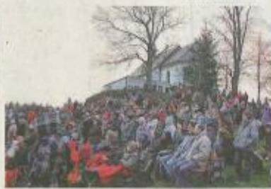
Allein schon die traumhafte Kulisse ist einen Besuch wert