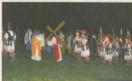
Jesus trägt sein Kreuz, und trifft auf Veronika, die ihm das Schweißstuch reicht.